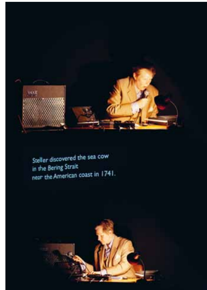
S is for Steller's Sea Cow (Sabine Ereklentz)

Geschichten der Menschentiere verstrickt sind, insbesondere mit der Kolonisierung.