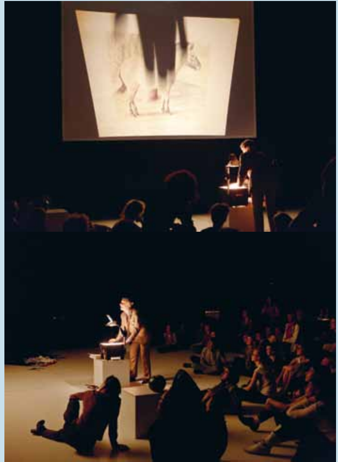
F is for Forest Tarpan

Eine ähnliche Dynamik hat auch die erste uns bekannte westliche Abc-Fibel »Orbis Sensualium Pictus« des Böhmi- schen Pädagogen Johann Amos Comenius (1658). Das ABC wird darin anhand von Lautmalerei (Onomatopäen) in Verbindung mit Tierlauten und den dazugehörigen Tierbildern erklärt: Der Bär brummet: Mum mum . Wir können nur staunen vor diesen Buchseiten: sie führen uns die geschrie- bene Sprache anhand von Tiermetaphern vor Augen, erklären also die dem Men- schen vorbehaltene Sprache mithilfe der Tiere, die die Sprache angeblich nicht brauchen. Vielleicht haben wir aber schon immer die Tiere gebraucht, um uns gemeinsam mit den Kindern darüber zu wundern, was Sprache ist und uns zu fragen, wer wir überhaupt sind.