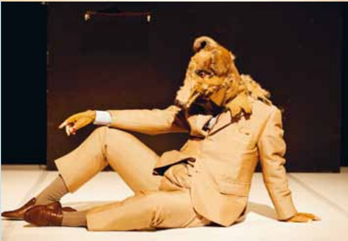
T is for Tasmanian Tiger (nach Steffi Weismann)